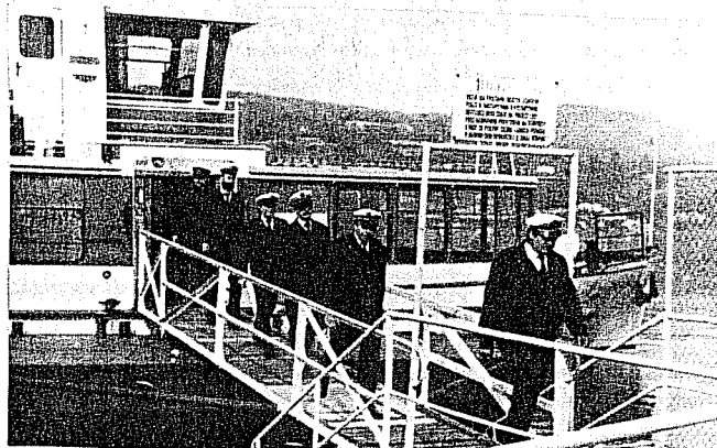
Brněňští »nápřehradníci« v současnosti již postupně šperkují svá plavidla, aby mohli v příštím roce takto slavnostně zahájit novou plavební sezónu. Foto 16. 4. 1994