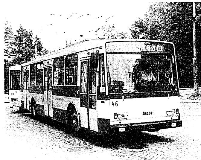
Na fotografii z 1. 6. 1998 je zachycen trolejbus 14TrM evid. č. 46 na lince »B« u nádraží v Jihlavě. Vůz je opatřen starším provedením nátěru – stejným jako mají klasické čtrnáctky.

Samozřejmě se v duchu hlasitě směji. Na jedné straně je povzbuzující, že časopis bere tolik lidí vážně. Na straně druhé si asi musím uvědomit, že tak, jako existuje závislost např. na hráčství, tak existuje závislost na tištěném periodiku (grafomanie?). Je také zajímavé, že napsat příspěvek je pro mnoho čtenářů takřka nemožné, ale neobdržení jednoho čísla je